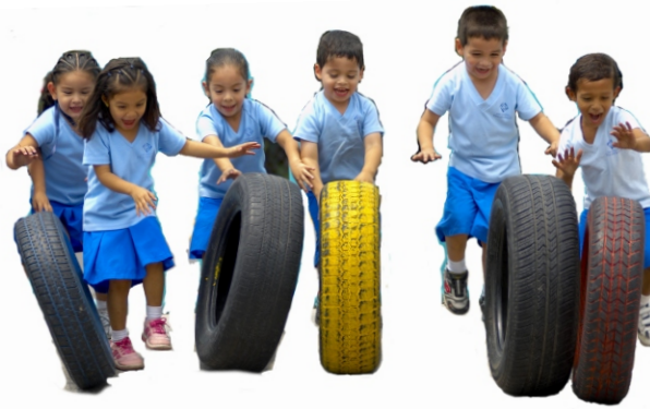
Jardines y áreas abiertas

Nuestras maestras y maestros poseen un grado de licenciatura en educación, psicología y/o pedagogía; además de haber sido capacitados en Reggio Emilia, Italia y con especialistas italianos, españoles y norteamericanos. Cada grupo esta a cargo de dos maestras titulares que acompañan y respaldan el desarrollo de las potencialidades de nuestras niñas y niños.